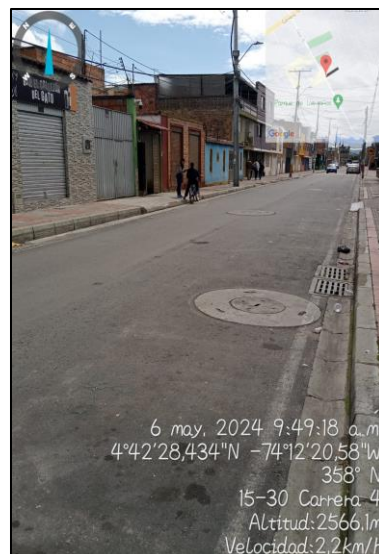
Ilustración 2. Recorrido por cuadrante